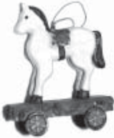
Lokomotiv från Danmark och häst från England.