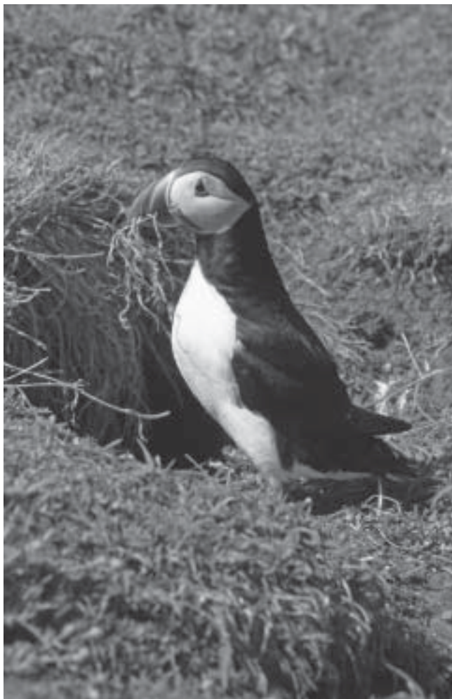
Lunnefågel med bomaterial.

vande föreställning när lunnefågarna utan paus hämtar bomaterial. Det blir en lång och underhållande sittning.