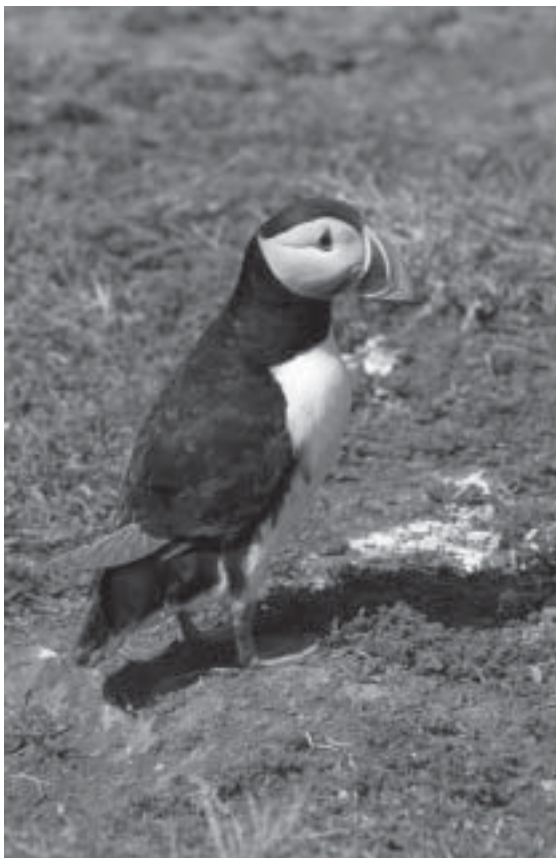
Lunnefågel på Skomer Island.

Vi hade bestämt oss, vi ville verkligen se lunnefåglar. Eftersom de inte längre finns i Sverige var det bara att bestämma sig för vart vi skulle åka.