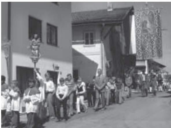
Helgonprocession i byn Axum i Tyrolen