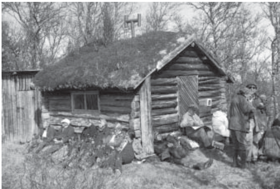
Fika för fjällvandrare.

och altare, ljuskrona, dopfont har växt fram allt eftersom.