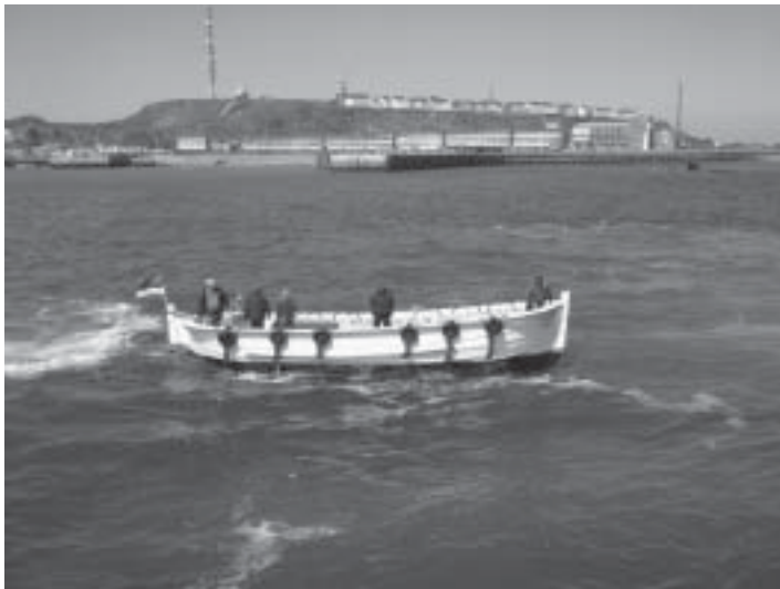
Påminner mig om landstigningarna på Karibienkryssningen.

hang. Under första världskriget evakuerades hela befolkningen, men de fick återvända 1918. Under 1930-talet hade det dåvarande Tyskland stora planer på att anlägga en ubåtshamn på ön, men pengarna och andra världskriget kom emellan.