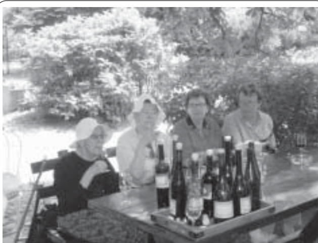
"Så ser det ut när tanterna kommer loss", Donauresan 2008, Bild och text: Monika Apell

När vi på kvällen kom tillbaka till vårt rum efter middagen på lodgen upptäckte